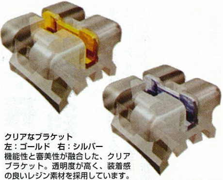
クリアなブラケット 左：ゴールド 右：シルバー 機能性と審美性が融合した、クリアブラケット。透明度が高く、装着感の良いレジン素材を採用しています。

歯並びを矯正したい、自信をもって笑顔でいたい！ キレイな歯並びは、虫歯や歯周病の予防になるだけでなく、笑顔の印象がグッと魅力的になります。とはいっても、歯科矯正期間は、痛みや治療期間の長さ、さらに見た目などを気にしてしまいがち。特