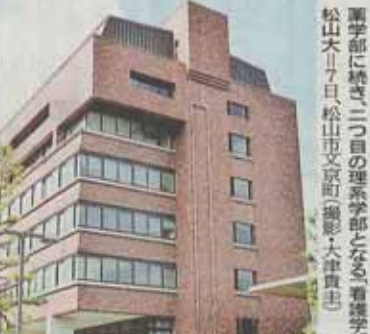
看護部に続き二つ目の理系学部となる、看護学部が検討されている松山赤十字病院(大津貴志)

3年制の松山赤十字看護専門学校(同市清水町3丁目)を、経営する松山赤十字病院は、数年前から校舎老朽化対策、高い専門知識を備えた看護師養成などを構築する中で、四年制大学への移行を検討。しかし、資金面の懸念や大学化に必要な敷地面積確保の問題などから自力移行を断念