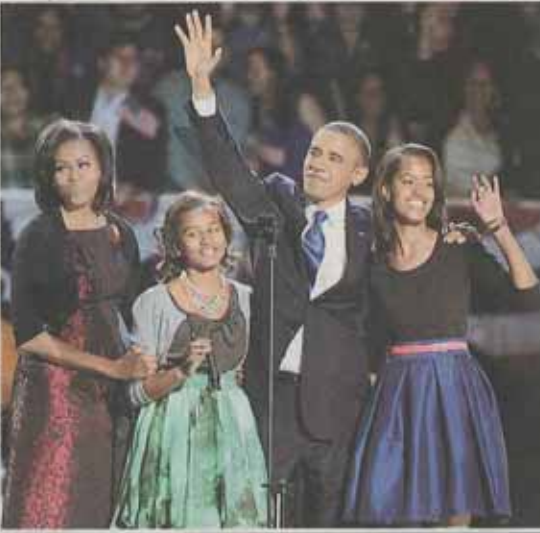
ロムニー候補との激しい選挙戦を制し、勝利宣言を聞くために集まった支持者に向かって手を振る米国のオバマ大統領(右から)と家族。7日未明、米イリノイ州シカゴ共同

オバマ氏は7日未明「家」として前進すると、だが大統領選と同時に親しくことが決定。超(日本時間同日午後、)して国民に緩和を呼び掛け、再選された。景気と雇用が最大の争点となった選挙で米国民は、経済再生には富裕層増税や福祉充実など「公平な社会」実現が必要だと訴えたオバマ氏を信任した。